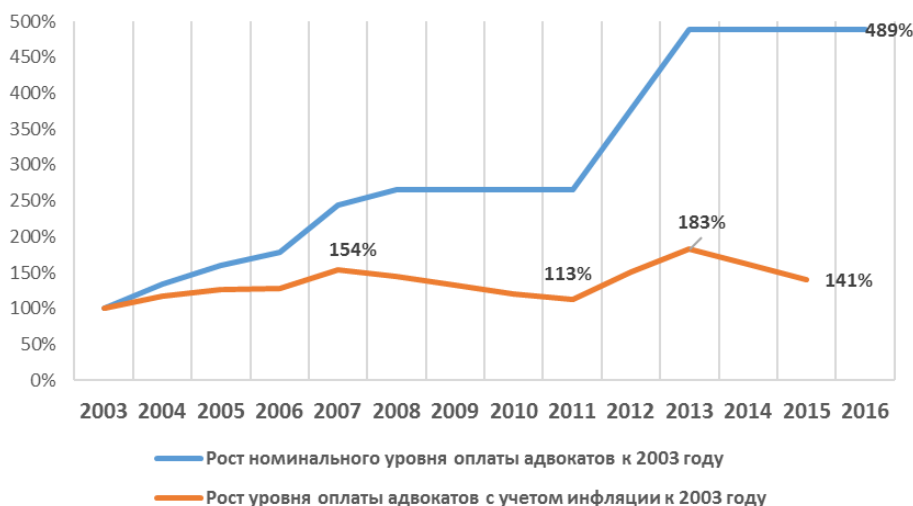
Рис. 2. Изменение номинального и реального уровня оплаты труда адвоката по назначению в сравнении с 2003 г.

ФПА, очевидно, понимает возникшую проблему, поэтому в апреле 2016 г. направила официальное письмо в Правительство РФ с просьбой существенно повысить уровень оплаты адвокатов по назначению 13 до 3000 руб. в день или 700 руб. в час, мотивируя это тем, что вознаграждение мировых судей и прокуроров значительно превышает уровень оплаты адвокатов. Таким образом, сообщество адвокатов требует поднять уровень оплаты труда адвоката не менее чем в 5 раз. В данной ситуации явно имеет место элемент «торга», поскольку даже сами адвокаты, по данным исследования [Казун, Ходжаева, Яковлев, 2015], называли медианную цифру оптимального уровня оплаты в 2000 руб. в день или 550 руб. в час. Запрошенная сумма также превышает тот уровень вознаграждения, который адвокаты получали бы в случае, если бы привязка к МРОТ сохранилась.