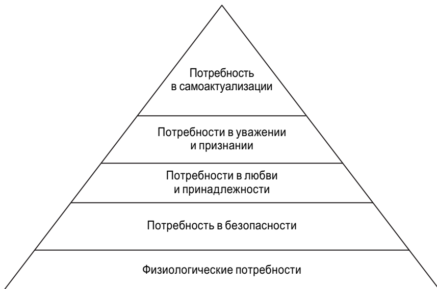
Рис. 4. Пирамида потребностей Маслоу

Принципиальное отличие человека психологического от человека экономического заключается в том, что его поведение исключает возможности замещения («размена») одних благ на другие: он не готов пожертвовать даже крошкой хлеба ради достижения сколь угодно высокой степени безопасности! Пока он голоден, он не начнет заботиться о безопасности; пока он не почувствует себя в полной безопасности, он не станет обзаводиться социальными связями; пока не будут удовлетворены его потребности в любви и принадлежности, он не станет стремиться к признанию и уважению; пока он не добьется признания и уважения, он не займется самоактуализацией. (Грубо говоря: о смысле жизни он станет задумываться только после полного удовлетворения своих сексуальных влечений...) Отсюда следует, что человек Маслоу не изобретателен и, по сути, действует как автомат: все его оценки уже сформированы за него чисто биологическими факторами. Стоит также отметить, что эмпирические предсказания, следующие из пирамиды Маслоу, настолько противоречат элементарному житейскому опыту, что даже странно, как такая искусственная конструкция могла завоевать всемирную известность и