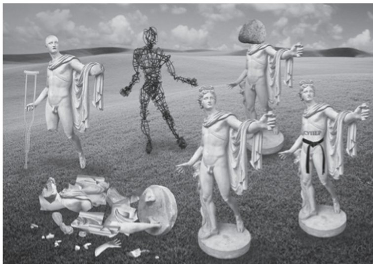
Рис. 1. Номо оeconomicus и К°

На этом рисунке конвенциональный Номо оeconomicus, воплощающий исходную («узкую») модель рационального выбора, изображен в виде ожившей скульптуры Аполлона Бельведерского, но только с неподвижной головой, всегда обращенной в одну и ту же сторону — в сторону корыстных материальных интересов. Однако рядом с ним мы обнаруживаем Супер-Аполлона, у которого голова может беспрепятственно поворачиваться во все стороны. Он может преследовать не только материальные, но и нематериальные цели и вести себя не только эгоистически, но и альтруистически. (На рис. 1 он представлен в виде скульптуры Аполлона с черным поясом и татуировкой «СУПЕР».) Единственное требование к его поведению — оно должно оставаться рациональным (иными словами, последовательным и внутренне непротиворечивым). Своим рождением Супер-Аполлон обязан упоминавшемуся ранее «экономическому империализму», выступившему с претензией на унифицированное объяснение любых возможных форм человеческого поведения исходя из расширенной модели рационального выбора.